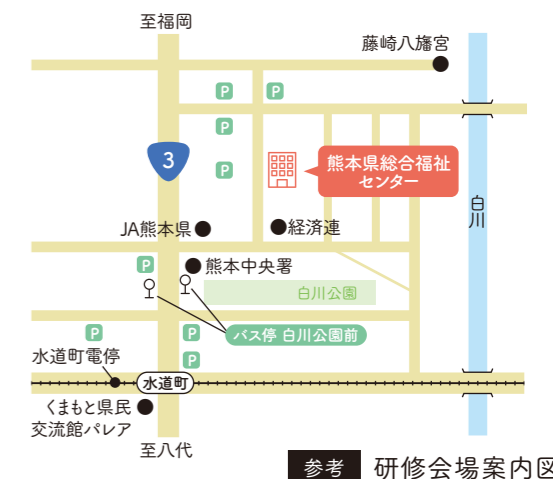
参考 研修会場案内図