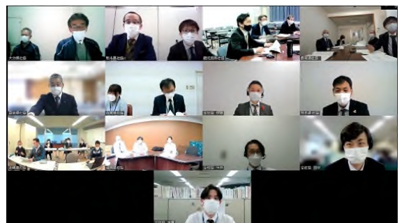
【研究協議会の様子】

債権管理を行う九州各県社協では、今回共有した課題や対応方法をもとに、令和5年1月から順次開始されるコロナ特例貸付の償還等の対応に取り組んでまいります。