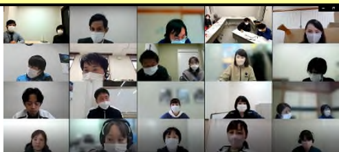
【連絡会議当日の様子】

12月22日(木)・23日(金)の両日、生活支援コーディネーター連絡会議を県北・県央・県南の3ブロックに分けてオンラインで開催し、計80名が出席しました。