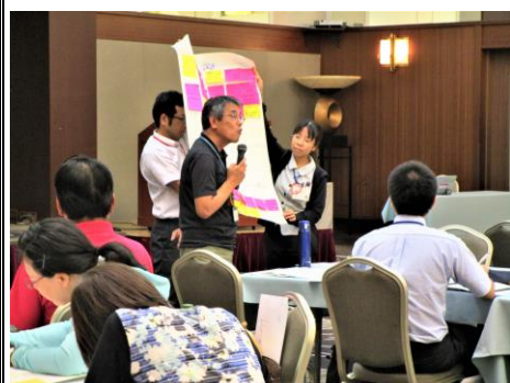
【グループワークの様子】

8月24日(金)に、KKRホテル熊本で「生活支援コーディネーター養成研修(基礎編)」を開催し、生活支援コーディネーター及び市町村の担当者等81名が参加しました。