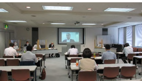
【運営委員会の様子】

また、資産運用の委託先である株式会社りそな銀行から退職共済制度財政決算状況の報告があり、運用実績及び今後の見通しについて説明がありました。