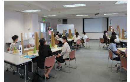
【グループワークの様子】

続いて、グループワークでは、参加者の就職に対する悩みや不安を共有しながら、その解決策について話し合いました。参加者からは「保育の現場の具体的な話が聞けて良かった」「勇気をもって就職活動にチャレンジしていきたい」という意見が聞かれ、保育士としての再就職を検討する契機となりました。