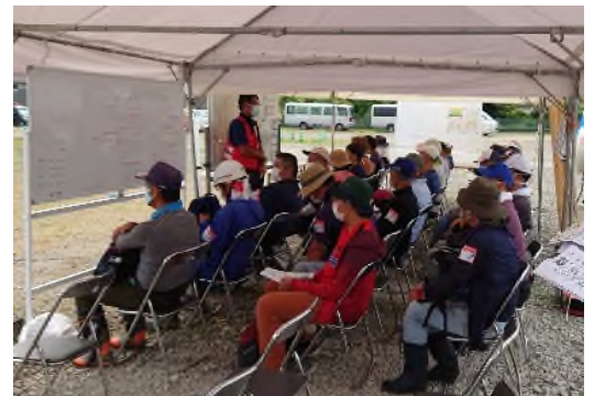
【八代市災害 VC の様子】

8月には荒尾市、小国町、相良村がセンターを閉所し、現在は通常のボランティアセンターとして活動しています。県災害ボランティアセンターとしては、引き続き、県内市町村社協の協力を得ながら、被災地の復旧に努めてまいります。 [令和2年8月30日現在]