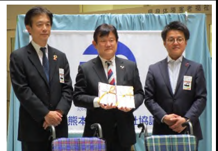
【左から椿原支社長・江口事務局長・池田労働組合委員長】