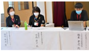
【10月20日の人吉会場での実践発表】

10月20日(火)と11月5日(木)に人吉市と八代市において、7月豪雨災害により地域支え合いセンターを設置した7市町村(八代市、人吉市、芦北町、津奈木町、相良村、山江村、球磨村)を対象に「市町村地域支え合いセンター基礎研修会」を開催し、市町村社協、市町村行政から計87名が参加しました。研修会では、県関係部署や関係機関からの事業説明を始め、熊本地震の際にセンターを設置した4社協(大津町、西原村、御船町、益城町)から今までの活動内容や反省点等について報告がありました。