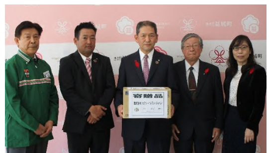
【寄贈式：益城町役場仮庁舎】

寄贈された商品は、各市町村社協を通じて、地域の社会福祉施設・福祉団体や生活に困難を抱えた個人・世帯への支援に活用されます。