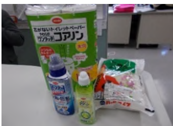
【提供物資(米、洗剤、トイレットペーパー等)】

「熊本県生活困窮者に対する緊急・一時支援事業」により、生活協同組合くまもとから食料品や生活用品300セットを購入し、KVOAD(くまもと災害ボランティア団体ネットワーク)を通じて、生活困窮者支援に携わるNPO等の支援団体に提供しました。