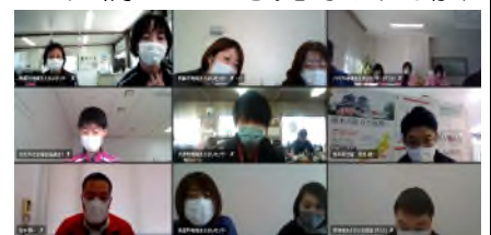
【菊池・阿蘇ブロック会議の様子】

今回の会議には、令和2年7月豪雨により開設された地域支え合いセンターからも参加があり、熊本地震で培った被災者支援の経験が、今後の被災者支援へつなげる学びの機会となりました。