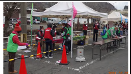
【災害ボラセン設置運営訓練実践の様子】

2月7日(日)に、山都町清和基幹集落センターで、「令和2年度山都町災害ボランティアセンター設置運営訓練」が実施され、山都町社協職員22名、益城町社協職員1名、県社協職員4名、地域住民ボランティア15名、合計42名が参加しました。