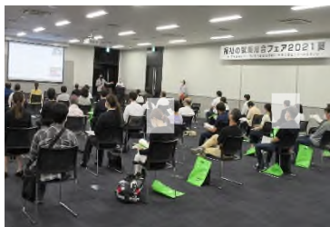
【オープニングイベント】

各面談ブースでは、求職者が熱心に仕事の内容や求人の詳細、働き方などについて情報収集するなかで、見学や面接を希望する求職者もあり、就職に向けての第一歩を踏み出す契機になりました。