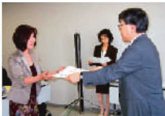
新規指定校に指定証書を授与しました

本会では、昭和53年より県内の小学校、中学校、高等学校を対象に「ボランティア協力校」を指定しています。これは学校内外における社会福祉に関する学習や体験活動等を通じ、児童・生徒が福祉への理解と関心を高め、ボランティア精神や社会連帯の精神を養うとともに、家庭及び地域社会へのボランティア意識の啓発を