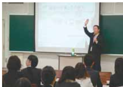
バックアップ講習会の様子

今春卒業予定の学生や一般求職者が、積極的に48事業所の人事担当者との面接に臨み、求人内容や業務内容について担当者からの説明を熱心に受けていました。