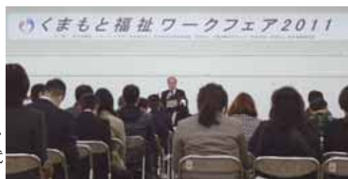
ワークフェア2011開会式の様子

2月19日(土)に熊本学園大学(参加者54名)、23日(水)に熊本社会福祉専門学校(参加者42名)で「福祉のお仕事就職希望者バックアップ講習会」を開催しました。福祉の仕事に関心のある方や福祉の職場へ就職を希望する方に対して、「福祉の仕事とその魅力」、「就職活動をするにあたっての心構え」について講義を行いました。