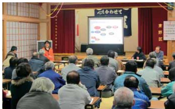
▲鹿北 東野地区座談会／地域福祉について