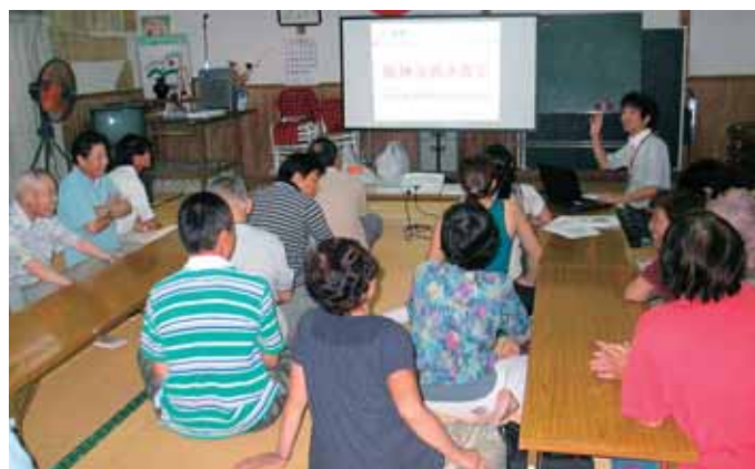
▲鹿央 姫井地区座談会／災害時要援護者避難支援計画について