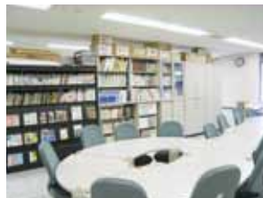
▲ミーティングルーム

火の国ボランティアフェスティバルの開催 ボランティア月間の推進 ホームページ等による情報提供など 各種研修会・セミナーの開催