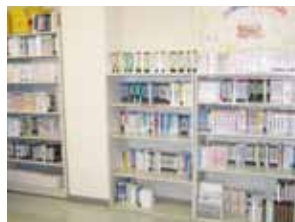
▲ビデオライブラリー