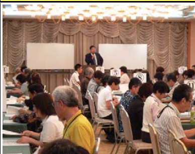
【分科会でのグループ演習の様子】

市町村社協の事業担当職員と生活支援員の資質向上を図ることを目的に、8月30日(木)、熊本交通センターホテルで生活支援員等研修会を開催し、152名の参加がありました。