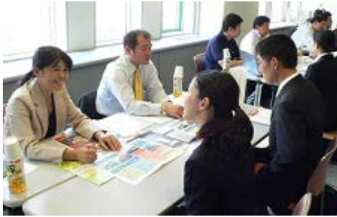
【就職面談会の様子】

9月1日（土）、県総合福祉センター研修ホールで「福祉の仕事就職セミナー」（福祉の職場説明会・就職面談会並びに福祉の仕事ガイダンス）を開催しました。