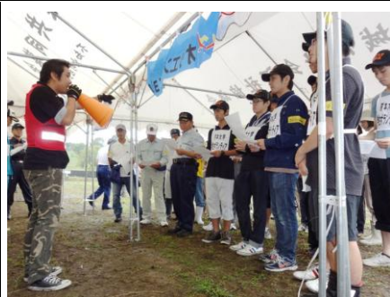
【活動上の注意事項の説明】

9月4日(日)、美里町の緑川ダム中の島公園で「美里町災害ボランティアセンター設置訓練」が「熊本県総合防災訓練」の一環として実施されました。