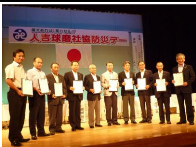
【調印を終えた各市町村社協会長】

9月11日(日)、球磨郡あさぎり町の「須恵文化ホール」で、人吉・球磨管内の市町村社協会長が出席し、「球磨ブロック社会福祉協議会災害時応援協定」の調印式がありました。