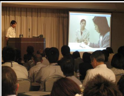
【午前中の講義の様子】

9月5日(月)に、熊本交通センターホテルで、「平成23年度 地域福祉権利擁護事業 生活支援員等研修会」を開催しました。