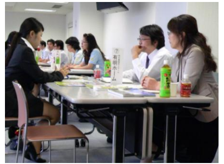
【就職面談会の様子】

また、福祉の仕事ガイダンスを同時に開催し、社会福祉士会やハローワーク熊本など5つの相談コーナーを設置し、福祉に関する資格や福祉の職場についての相談に応じました。