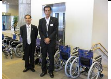
【寄贈された7台の車椅子】

<住友生命労働組合熊本支部> 5台 ・水俣市社協・小国町社協・合志市社協・荒尾市社協・天草市社協 車椅子は、各市町村社協の福祉事業に有効に活用されます。