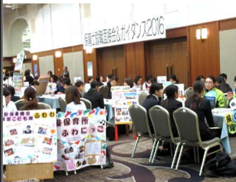
【保育士就職面接会の様子】

介護、保育等の福祉関係業務に携わる人材を確保し、福祉サービスの充実を図るため、本年度も11月3日(木)に「保育士就職面接会 & ガイダンス2016」、11月11日(金)に「福祉の就職総合フェア2016」を熊本市のK K Rホテル熊本で開催しました。求人需要が増す一方、求職者が伸び悩む状況の中で、保育士就職面接会には求人45法人に98名の求職者(一般43、学生55)、福祉の就職総合フェアには、求人48法人に70名の求職者(一般49、学生21)が参加し、事業所との面談に臨みました。