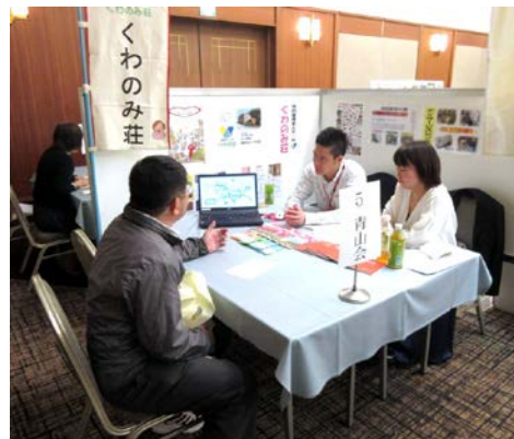
【福祉の就職総合フェアでの面談】

介護、保育等の福祉関係業務に携わる人材を確保し、福祉サービスの充実を図るため、本年度も11月3日(木)に「保育士就職面接会 & ガイダンス2016」、11月11日(金)に「福祉の就職総合フェア2016」を熊本市のK K Rホテル熊本で開催しました。求人需要が増す一方、求職者が伸び悩む状況の中で、保育士就職面接会には求人45法人に98名の求職者(一般43、学生55)、福祉の就職総合フェアには、求人48法人に70名の求職者(一般49、学生21)が参加し、事業所との面談に臨みました。