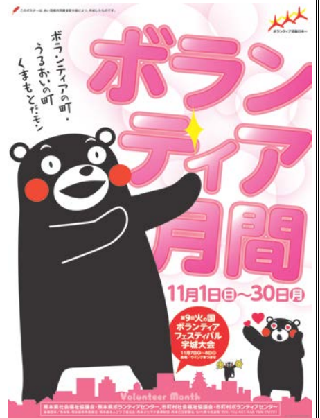
【平成27年度 月間ポスター】