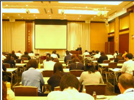
【各事業との連携方法を説明】

後、事業担当課から、各事業の目的や役割、具体的な業務内容、具体的な自立相談支援事業との連携方法などについて説明しました。