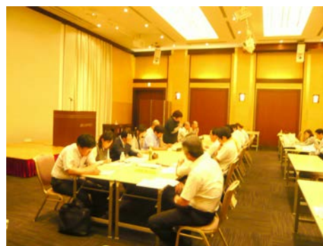
【主任相談支援員の情報交換会】

今回の研修会は、自立相談支援事業における相談支援の流れや事業の具体的な展開方法、生活福祉資金貸付事業の改正点と事務取扱いの方法等について理解を深めるとともに、自立相談支援事業と生計困難者レスキュー事業、生活福祉資金貸付事業、地域福祉権利擁護事業との連携を強化することを目的に企画したもので、開会挨拶の