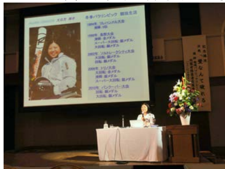
【パラリンピック金メダリスト 大日方氏】

大日方氏は、1998年の長野パラリンピックのチェアスキー(滑降)で金メダルを獲得し、日本人初の冬季パラリンピック金メダリストになられ、同大会に5連続出場し、引退されるまでに計10個のメダルを獲得されておられます。