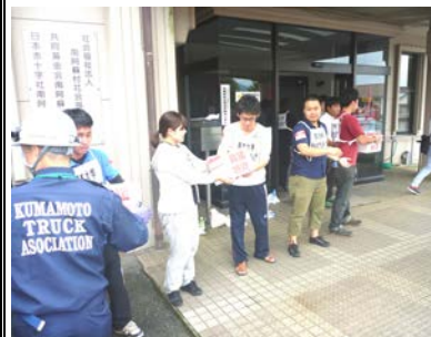
【救援物資を運搬する熊助組】

災害ボランティアセンターに全国から駆け付けるボランティア役には、熊本大学学生災害復旧支援団体「熊助組(くますけぐみ)」、日本青年会議所九州地区熊本ブロック協議会(JC熊本)、山都町社協災害ボランティアセンターサポーター養成講座受講者など約120名の方々が参加しました。