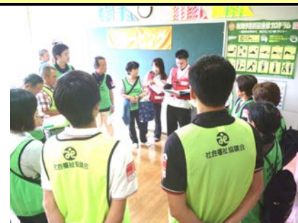
【活動内容の詳細を説明】

県内市町村社協や関係機関からの視察も多く、センター設置への理解・協力がなお一層深まる訓練となりました。